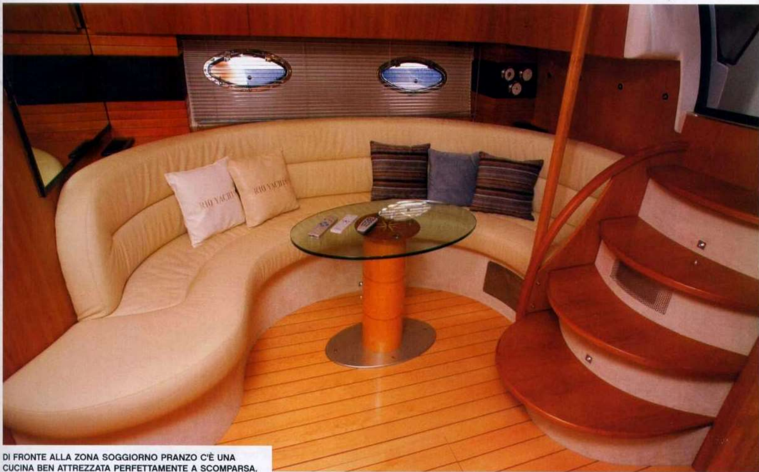
DI FRONTE ALLA ZONA SOGGIORNO PRANZO C'È UNA CUCINA BEN ATTREZZATA PERFETTAMENTE A SCOMPARSA.

hanno disegnato un hard top con tetto scorrevole, sormontato da un elegante alettone porta antenne che ha la caratteristica di lasciare il profilo del parabrezza completamente libero. Questo artificio, indispensabile su una barca di 13 metri e mezzo, consente al pilota di guidare in piedi, con il viso e i capelli al vento, esattamente come se fosse sulla versione aperta. Quando la voglia di aria si è esaurita, o le condizioni meteo si fanno critiche, per spruzzi o pioggia, o quando la dolce compagnia femminile o filiale richiede ombra e protezione, il paziente pilota chiude il suo tetto, con un gesto semplice e rapido e si accomoda sulla poltrona dedicata, potendo pilotare il suo coupè in tutto comfort. Non è facile adattare nuove soluzioni a impianti esistenti e far combaciare esigenze diverse, tendenzialmente crescenti, con strutture ed elementi già esistenti, ma l'équipe di Villongo ha saputo armonizzare con maestria il cabrio col coupè e armonizzare il nuovo genere alle aspettative della sua numerosissima clientela. Dell'originale 44 Art rimane il pozzetto sostanzialmente basato su tre elementi, il divano perfettamente semicircolare ser-